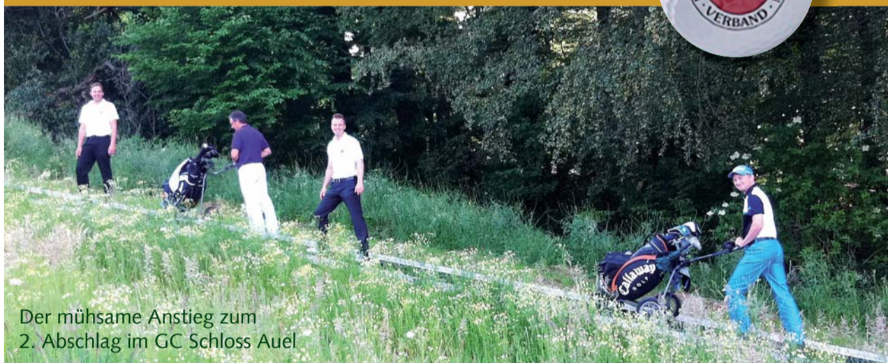
Der mühsame Anstieg zum 2. Abschlag im GC Schloss Auel